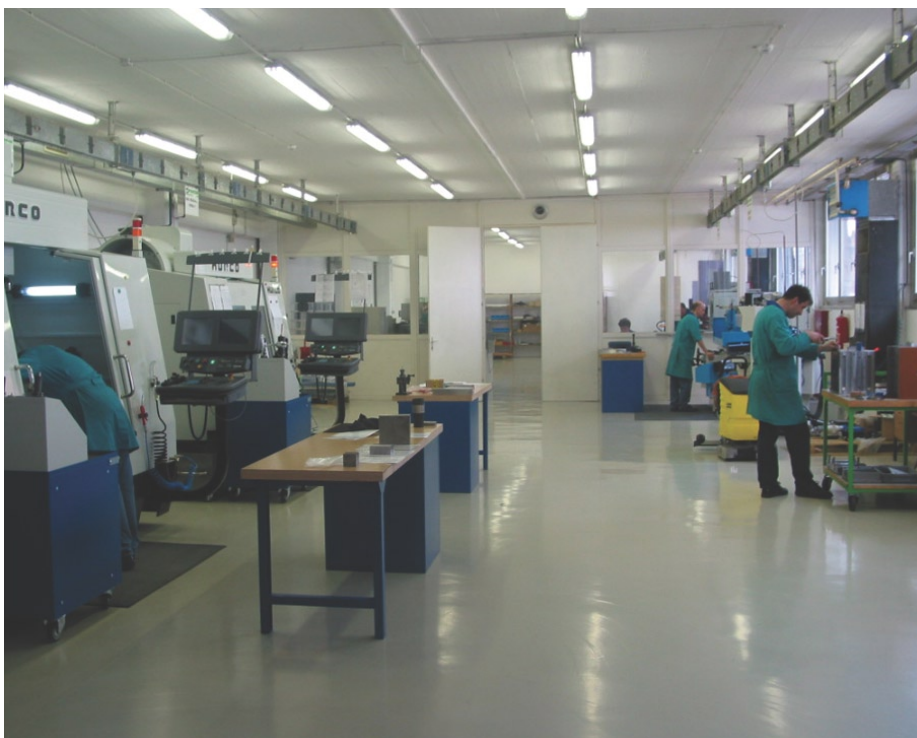
Orodjarna je informacijsko in tehnološko na najsodobnejši ravni